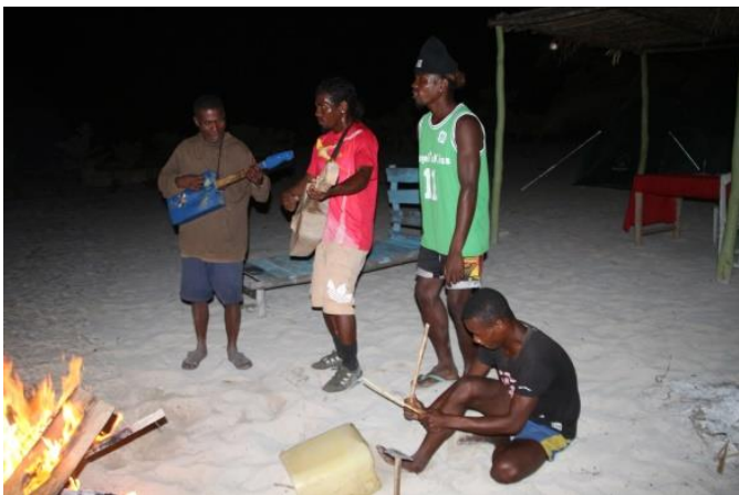
Musiker mit selbstgebauten Instrumenten.