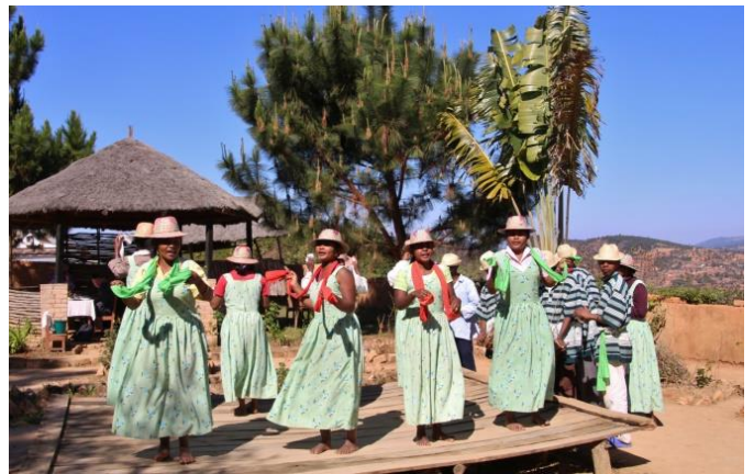
Tanz- und Gesangsgruppe im Hochland Madagaskars.

Dieses traditionelle Volksfest wird in den Reisanbaugebieten gefeiert und findet Ende Mai statt.