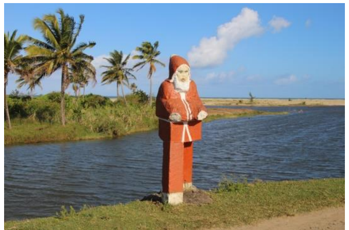
Der Weihnachtsmann ist auch in Madagaskar präsent.

Wie im engsten Familienkreis das Weihnachtsfest gefeiert wird, davon berichtet MAMIHERISOA Aмоса Fandresena weiter unten.