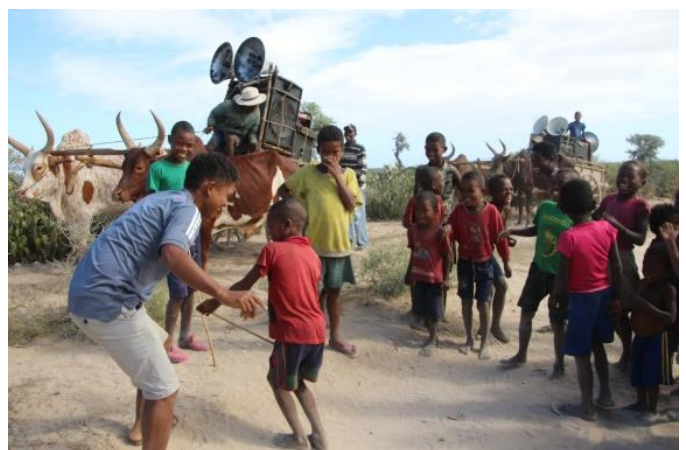
Tanzen geht immer und überall.