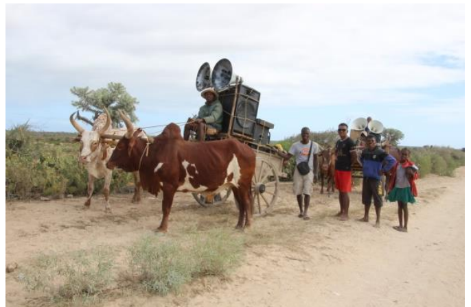
Musikanlage auf einem Zebu-Karren.