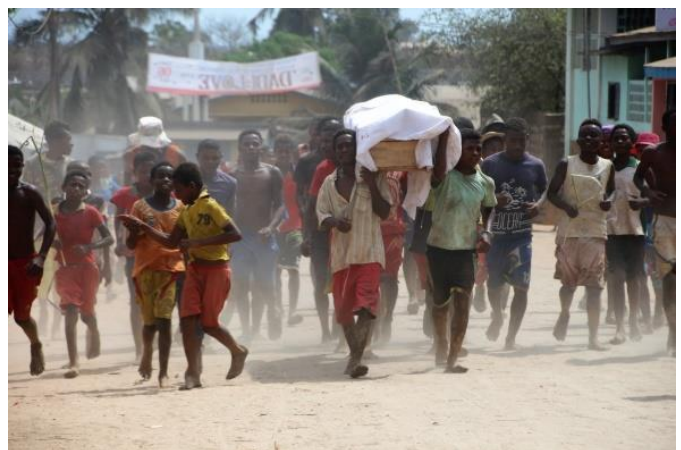
Totenfest in einem madagassischen Dorf.

Dieses Fest wird alle sieben bis neun Jahre gefeiert; es gibt kein festes Datum dafür. Im Zuge der Zeremonie werden die Leichname der verstorbenen Angehörigen aus ihren Gräbern geholt. Danach tragen die Familienmitglieder die Toten über ihren Köpfen in einer Prozession ins Dorf oder an einen besonderen Ort, an dem sie die Zeremonie fortsetzen. Die Toten „feiern“ dabei zusammen mit ihren lebenden Verwandten ein Fest, bei dem gegessen, getrunken und sogar mit den Leichnamen getanzt wird.